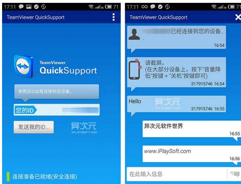
图 2 起动手机 TeamViewer QuickSupport 的画面 (中文版) (抹去了自己的 ID)。

连接成功后手机便会登入到上图右的界面。得益于 Teamviewer 强大方便的远程连接技术，你并不需要关心公网 IP 地址、端口、防火墙这些，完全不需任何设置。