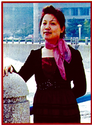
改掉開牽笑話的習慣後，她就找到工作了。